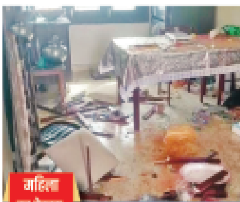
महिला का देखभाल करने पर 18 गिरफ्तार

बैडरूम से घसीटकर निकाला, फिर अगवा किया पुलिस ने बताया कि लाठी-धूसों का नाम