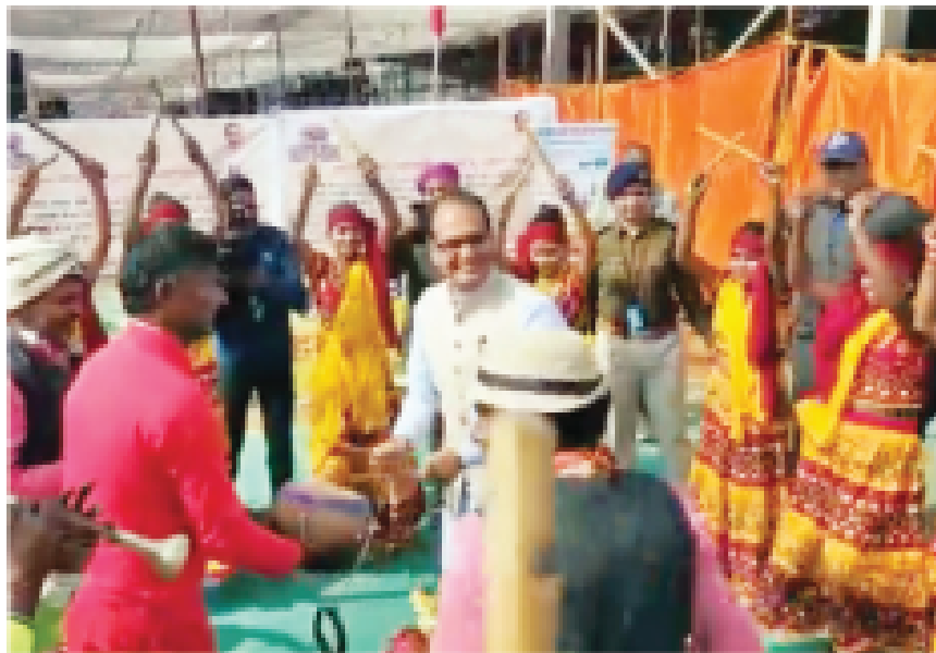
स्थानीय कलाकारों के साथ सीएम ने किया डांस

बंध से सीधी की जनता को संबोधित करते हुए सीएम ने कहा कि जनता ही जनार्दन है। मैं पूरी प्रशासन से कहता हूँ कि जनता की बेहतरीन सेवा की जाए। हम सभी लोकतंत्र में जनता के सेवक हैं। हम अच्छा काम करेंगे हमारी दृष्टि है। लोकतंत्र का मतलब है जनता का राज। जनता के राज का मतलब है कि जनता को दफ्तरो के चक्कर न लगाना पड़े और जल्द काम बंध में हो सके। सीएम ने कहा कि जनजातीय समानता को सुरक्षित बनाने के लिए हमने पैसा बचाना शुरू किया है। वह तैय्यार खुद तैय्यार और खुद तैय्यार। एक नया काम स्वतंत्र, जहाँ जनता सौधीर है। सीएम ने कहा कि हमने लक्ष्य कि अनेक जनसंख्यावर्गीय योजनाओं का लाभ लेने के लिए जनता को सरकारी दफ्तरो के चक्कर नहीं लगाना पड़ेगा और सरकार खुद चलकर उनके पास जाएगी। मुझे सबसे बड़ा खुशी है कि सीधी जिले में 7.59 लाख आवेदन आये और करीब 7.02 लाख आवेदन स्वीकृत कर दिए गए। सीधी में 1.57 लाख आवेदन आये और 1.25 लाख आवेदन स्वीकृत हो गए हैं।